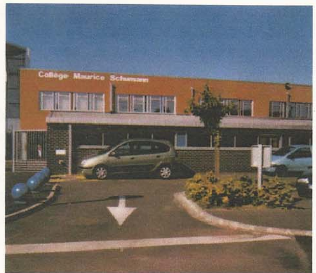
PECQUENCOURT Opération "Portes ouvertes"