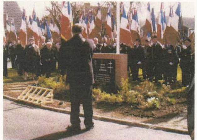
ARNEKE : Hommage à Maurice Schumann 72 Drapeaux !