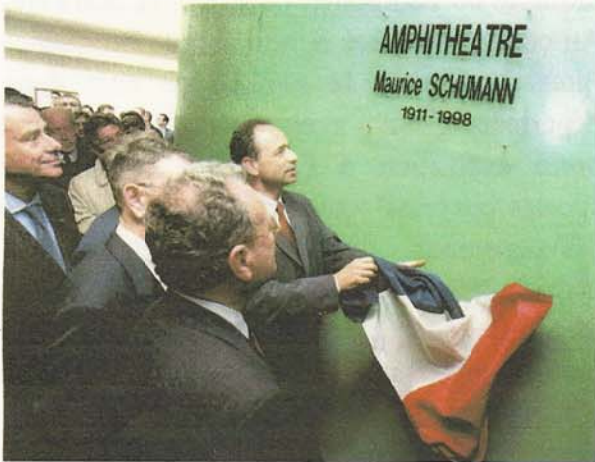
École nationale des douanes de Tourcoing Le drapeau de l'inauguration est remis au Cercle militaire